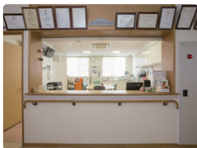
ナースステーション