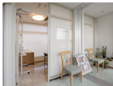
カンファレンスルーム