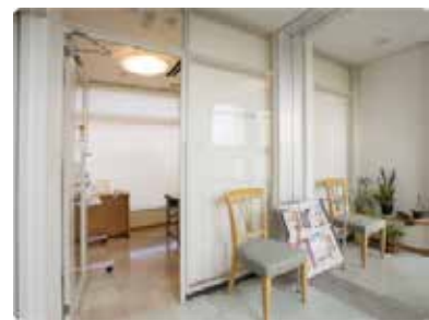
カンファレンスルーム