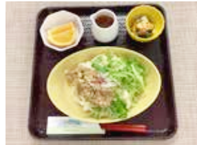
【 並食 】