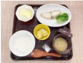
【 全粥食 】